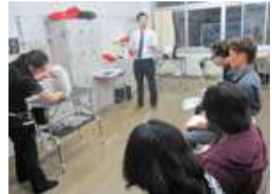
職業体験ガイダンス