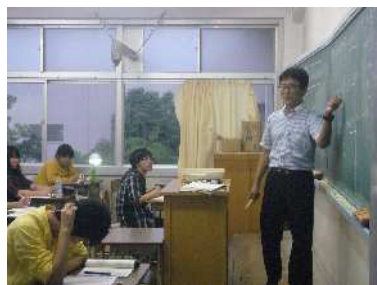
授業風景 (習熟度別 数学)

本校は中学で勉強が苦手だった人、しばらく学校生活から離れた人など、様々な生徒が集まってきます。そこで授業は、基礎的な学習で不足しているところがないか、ゆっくりと確かめながら進めるようにしています。卒業までの年数は、通常4年かかりますが、3年間で卒業することも可能です。