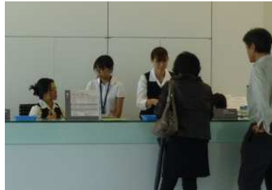
インターンシップ(受付業務)