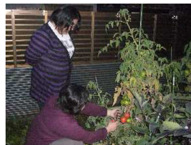
総合的な学習の時間 (野菜を作ろう)