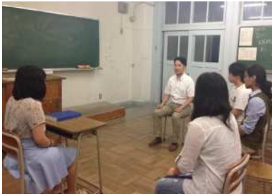
外部講師による面接指導

体験的な学びを重視した キャリア教育を推進 し、生徒個々の 進路指導を充実 させるため、様々なガイダンスを企画運営します。