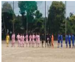
サッカー部 (県大会3回戦進出)

中学校では経験できなかったことをこの学校でたくさん経験できて新鮮です。基本的な勉強が身に付くので将来のためになりそうです。友達といっぱい遊んだり勉強できたり楽しい高校生活です。